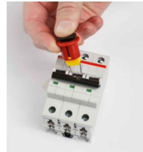
BY 02480A – miniaturní univerzální uzávěr jističe