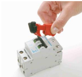
BY 0247B9 – miniaturní uzávěr jističe ABB MS325 (Pin Out pro ABB jističe řady MS325)