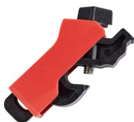
Pin Out ABB MS325 Miniaturní univerzální uzávěr