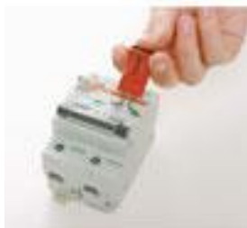
BY 0162E6 – miniaturní uzávěr (TBLO= Tie-Bar)