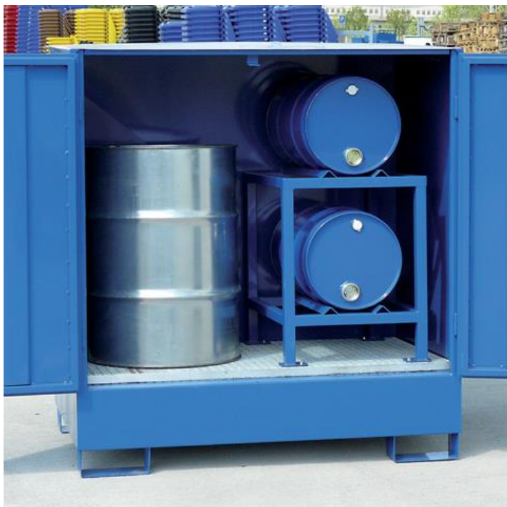
Ilustrační foto – krytá záchytná vana PLN 1291 s vloženým stojanem PLN 1292.

Pro zajištění vyšší bezpečnosti a stability lze stojan aretovat k roštu záchytné vany, na které je umístěn.