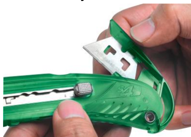
Uložení náhradní čepele