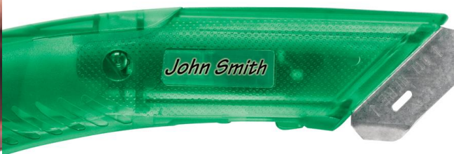
Plocha pro označení